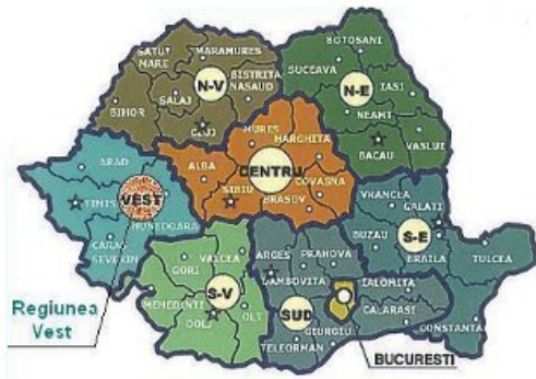
Regiunea de Vest