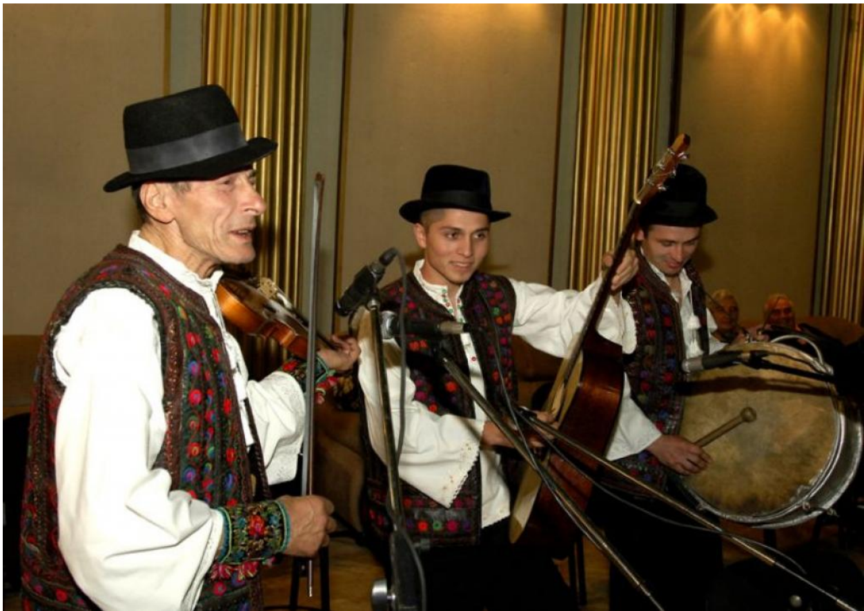
Instrumentiști, cântând la ceteră, zongoră și dobă.

Cetera este, de fapt, o vioară acordată bine sustinând partitura armonică. Zongura (sau zongora) este chitara care asigură partea ritmică a melodiei, cu ajutorul a două sau patru coarde, acordate, de asemenea, atipic. Doba (sau toba), compusă dintr-o toabă mare și un cinel (zis țingălău sau cingeteu), el imprimă, de asemenea, ritmul melodiei. Materialele folosite pentru confecționarea respectivelor instrumente erau bine definite: cetera era cioplită din lemn de brad sau din molid de rezonanță, la fel ca și zongura, iar strunele erau manufacturate din intestine de animale sau din păr de cal. Membrana tobei era lucrată din piele .