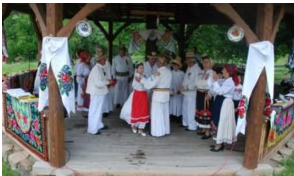
Șezătoare în aer liber