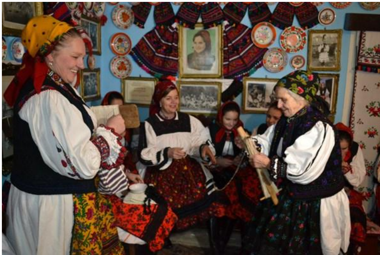
Șezătoarea în incinta unei case.

În afară de faptul că se cunoșteau cu cei aleși, fetele învățau în aceste șezători și lucrul femeilor în casă printre care torsul, scărmanatul, țesutul, depănatul și altele. De la șezătoare nu pot lipsi nici țâpuriturile, tropotiturile vestite în Oaș.