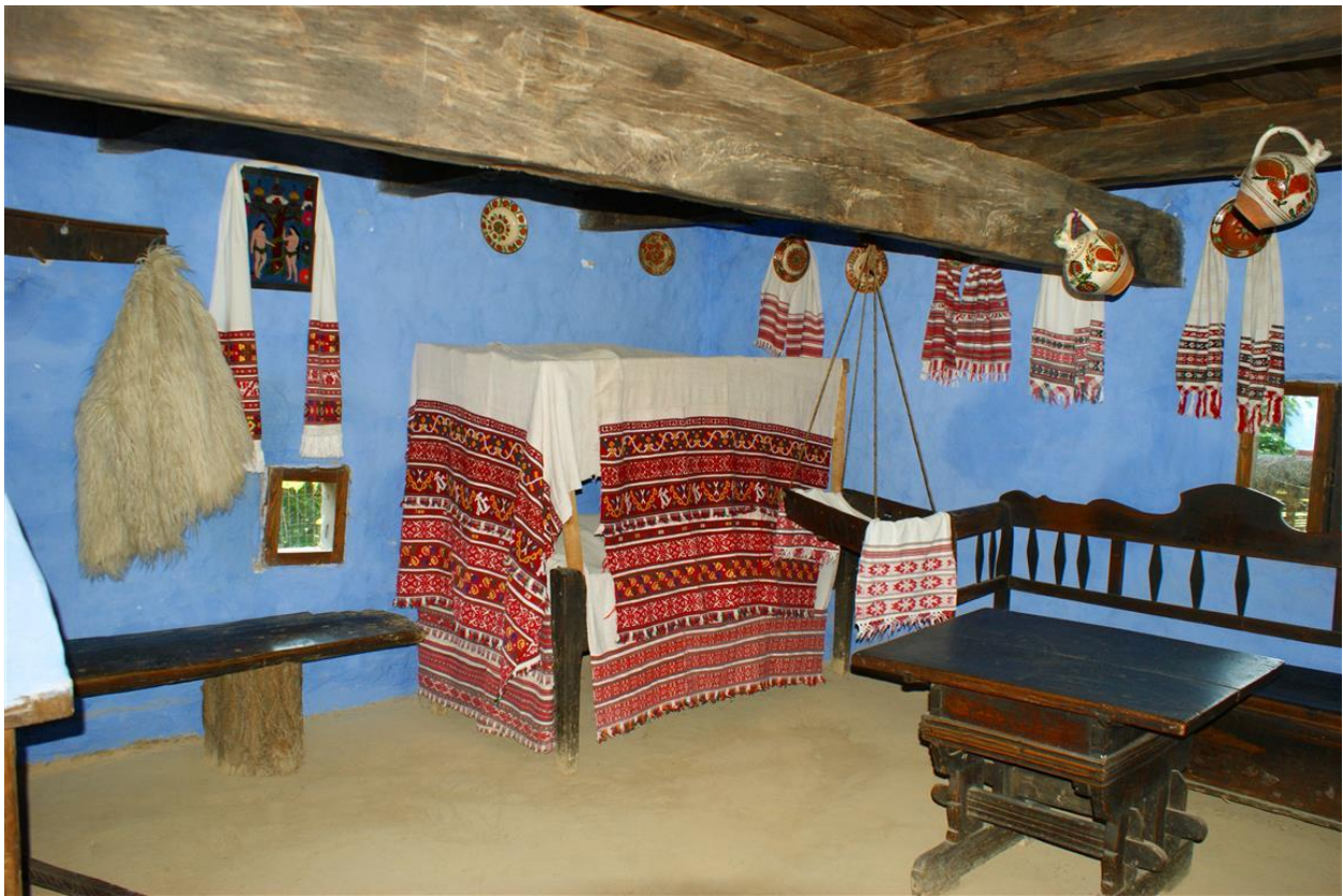
Interiorul casei din Țara Oașului